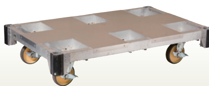
パイプ台車アルミ製 1221×771 [コード]03174-15