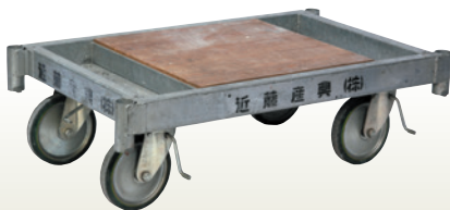
パイプ台車 1200×800 [コード]03174-11