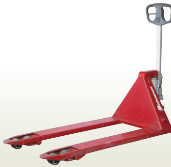
キャッチ・パレット 3t [コード]03172-30