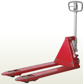
キャッチ・パレット 1.5t [コード]03172-15