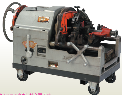
パイセット 6インチ [コード] 03101-51