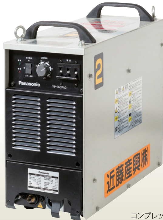
コンプレッサ内蔵型