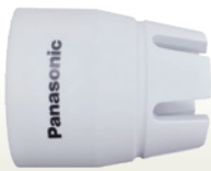
エアープラズマ切断機 PA60 ノズル (販売) [コード]03070-32