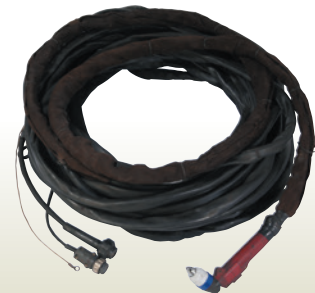
エアープラズマ トーチ付ホルダ 30m [コード] 03070-73