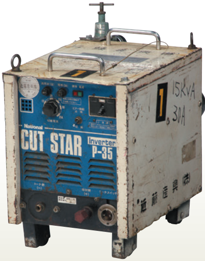
エアープラズマ切断機 P35 [コード] 03070-11