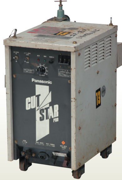
エアープラズマ切断機 P80 [コード] 03070-21