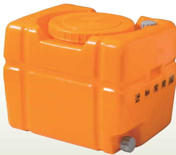
ポリローリータンク 200L バルブ付