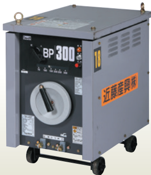
交流アーク溶接機 300A [コード]03063-30