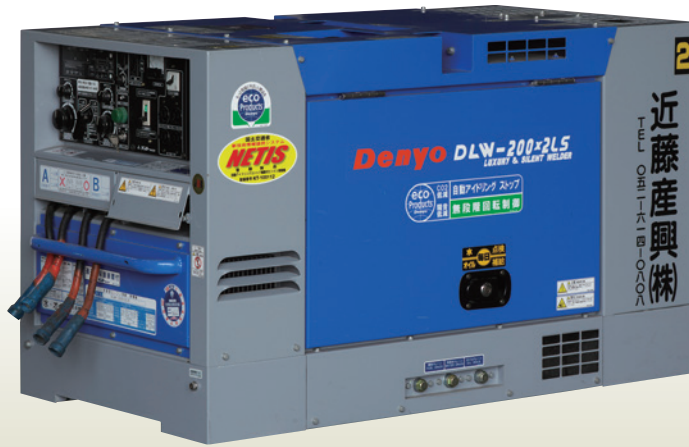
ウェルダー 340A防音型 2人用 [コード]03061-71