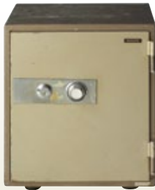
金庫 据置 90Kg [コード] 15174-23