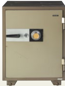
金庫 据置 170Kg [コード] 15174-26