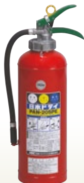
消火器 20型 サイズ:ABC 20型 [コード] 05055-11