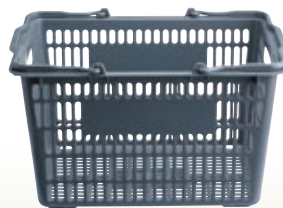
買い物カゴ 樹脂製 サイズ:W400×D300×H200 [コード] 15170-41