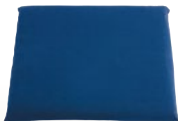
座布団 スポンジ サイズ:W450×D450 [コード] 15170-26