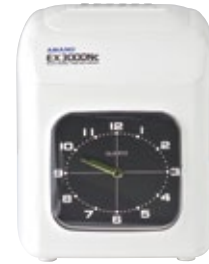
タイムレコーダー AC100 [コード] 15174-61