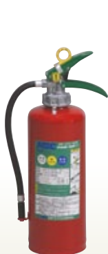
消火器 10型 サイズ:ABC 10型 [コード] 05055-01