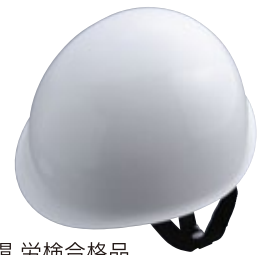
安全帽 労検合格品 [コード] 15172-62