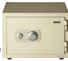
金庫 据置 60Kg [コード] 15174-21