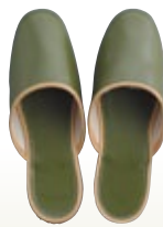
スリッパ 緑 [コード] 15170-16