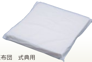
座布団 式典用 サイズ:W350×D350 スポンジ [コード] 15170-28