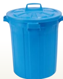
ポリ容器 45L 430 H480 [コード] 13160-16