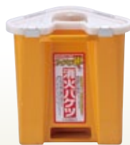
三角消火バケツ サイズ:H355 7.0L [コード] 05055-86