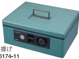
金庫 手提げ [コード] 15174-11