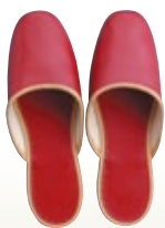
スリッパ 赤 [コード] 15170-12