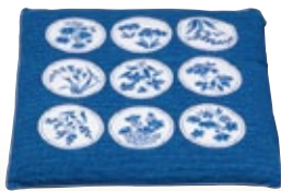
座布団 綿 サイズ:W450×D450 [コード] 15170-21