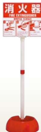
消火器スタンド N-1型 [コード] 05055-82