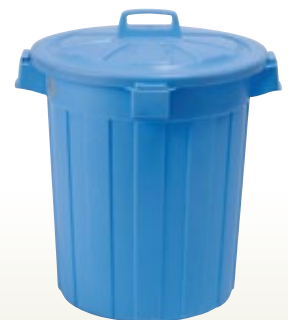
ポリ容器 70L 490 H550 [コード] 13160-18