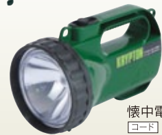
懐中電灯 [コード] 15173-51