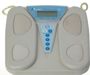
ヘルスマーター 130kg 体脂肪計付 サイズ:W314×D311×H49 [コード] 13148-17