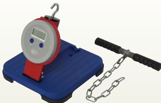
背筋力計 標準型 240kg サイズ:W315×D315×H328 3.7kg [コード] 13148-36