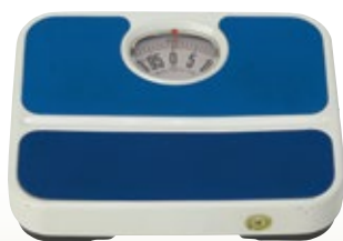
ヘルスマーター 100kg サイズ:W300×D240×H60 [コード] 13148-16