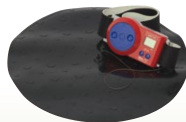
ジャンプメジャーMD サイズ:本体 W137×D35×H85 0.6kg [コード] 13148-52