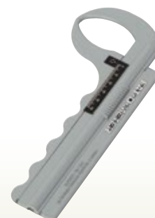
皮下脂肪厚測定器 [コード] 13149-36