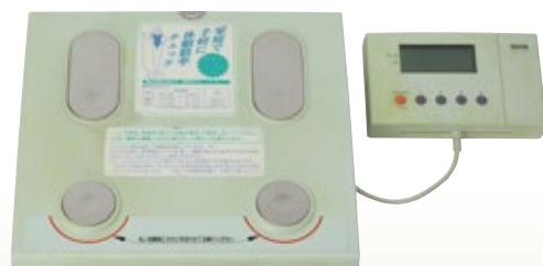
ヘルスマーター 150kg 体脂肪計付 サイズ:W296×D322×H54 [コード] 13148-18