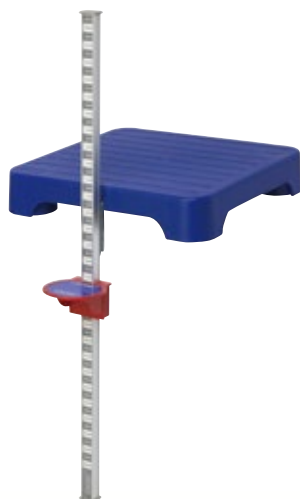
立位体前屈器 サイズ:W292×D397×H602 1.3kg [コード] 13148-46