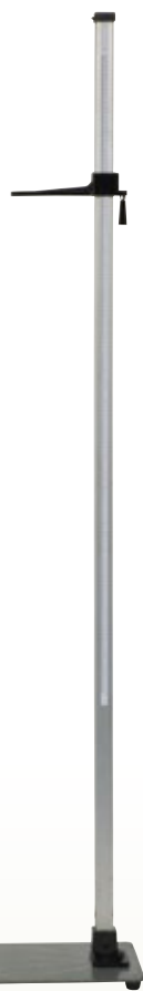
身長計 サイズ:W300×D410×H2120 [コード] 13148-26