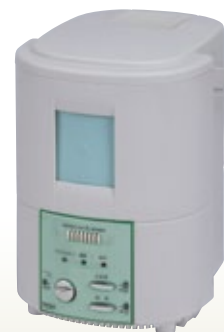
スチーム加湿器 MATRIC SUKS 45 サイズ:W230×D270×H310 [コード] 04143-45