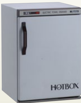
オシボリ保温機 200 AC サイズ:W400×D420×H580 電 源:AC100V [コード] 12098-14