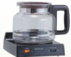
コーヒーウォーマー AC100 サイズ:W186×D213×H190 容 量:1,800ml 電 源:AC100V [コード] 12099-10