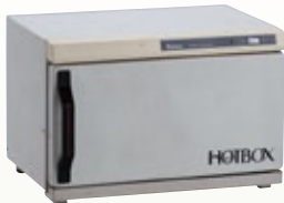
オシボリ保温機 50 AC サイズ:W420×D280×H280 電 源:AC100V [コード] 12098-13