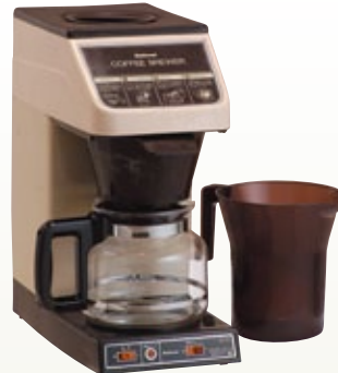
コーヒーブローワー AC サイズ:W191×D375×H405 電 源:AC100V [コード] 12099-11