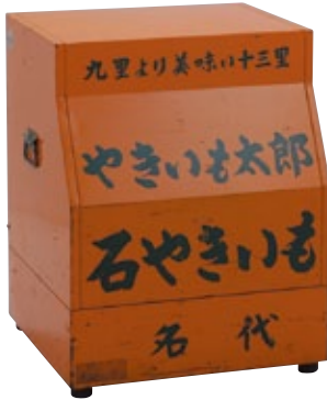
やきいも機 AC 保温室付 サイズ:W590×D530×H740 電 源:AC100V [コード] 12103-06