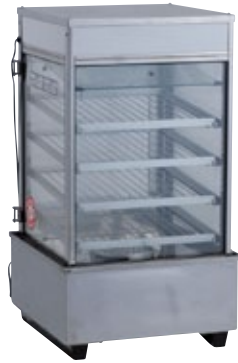
肉まんあんまん蒸し器 9×4 サイズ:W372×D394×H685 電 源:AC100V 容 量:36個 [コード] 12101-51