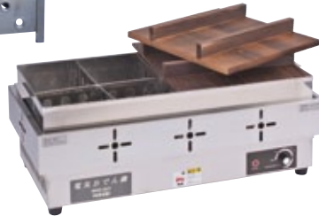
おでん鍋 A C 100 サイズ:W630×D335×H277 電 源:AC100V 容 量:21.5L [コード] 12098-18