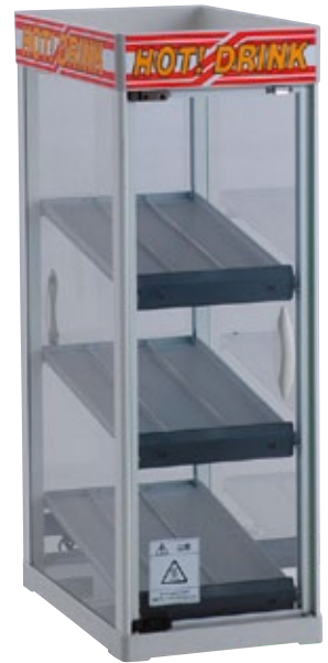
カンウォーマー 54本用 電 源:AC100V 容 量:190ml・250ml 缶54本 [コード] 12099-03