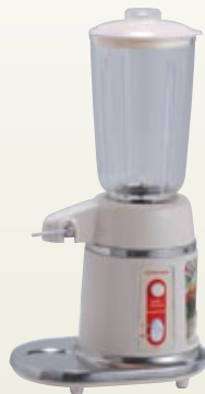
ミキサー業務用 1.8L [コード] 12103-02