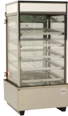
肉まんあんまん蒸し器 9×5 サイズ:W380×D430×H768 電 源:AC100V 容 量:45個 [コード] 12101-52