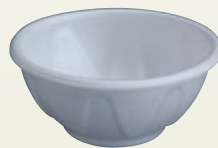
スチロールどんぶり 100ヶ 販売品 [コード] 12130-21