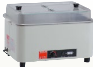
酒燗付器 HS-120 A C サイズ:W427×D295×H210 電 源:AC100V [コード] 12100-01