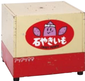
やきいも機 AC 保温室無し サイズ:W580×D530×H500 電 源:AC100V [コード] 12103-05