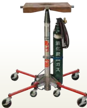
気圧ホイス 5.5m [コード]03180-11 炭酸ガスボンベ [コード]03180-56 炭酸ガス 7kg (販売) [コード]03180-51