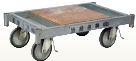
パイプ台車 1200×800 [コード]03174-11

使用上、安全のため、上図の荷重範囲で使用ください。また、3.8m以上の持上高さになる場合には制限重量は50となります。(荷台・パイプを含む)