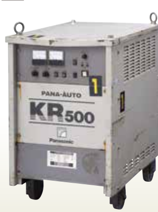
炭酸ガス自動溶接機 500A統合 [コード]03063-93