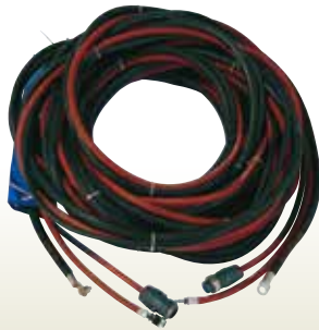
炭酸ガス 500A統合 延長線20m [コード]03063-95