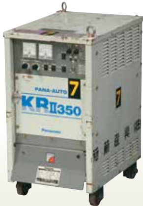
炭酸ガス自動溶接機 350A統合 [コード]03063-73