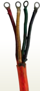
キャプタイヤ 60sq [コード] 03004-60