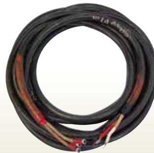
キャプタイヤ 38sq [コード] 03004-38