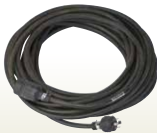
キャプタイヤ 5.5sq 4P引掛付 20m [コード] 03004-04