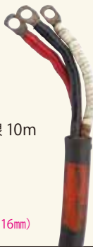
分電盤用一次線 10m [コード] 03006-91